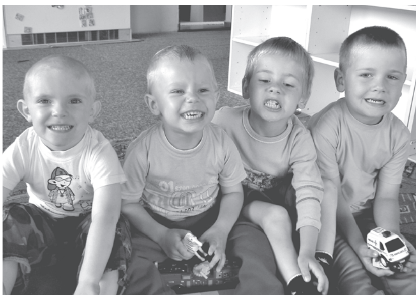
Chlapci "vystrúhli" úsmevy od ucha k uchu ako pravé americké hviezdy!

Na záver by som sa chcela poďakovať všetkým sponzorom, ktorí nás počas roka podporovali a tiež prisľúbiť, že aj v nasledujúcom školskom roku chceme naďalej pracovať tak, aby deti do MŠ rady chodili. (mš)