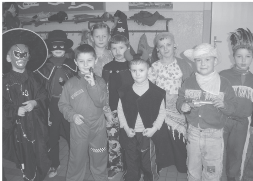
Masiek od výmyslu sveta, takto sa plesalo na maškarnom bále!