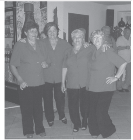
Pri hudbe aj pri tanci, každý si rád poskočí!

Ľudia nemôžu nepretržite pracovať, potrebujú odpočinok. „Odpočinok však nie je konečným cieľom dôchodcov.“ Starnúť neznamená upadať telesne ani duševne. Príkladom je naša organizácia Jednoty dôchodcov (ďalej JD), v ktorej si 87 členov stanovilo iné priority.