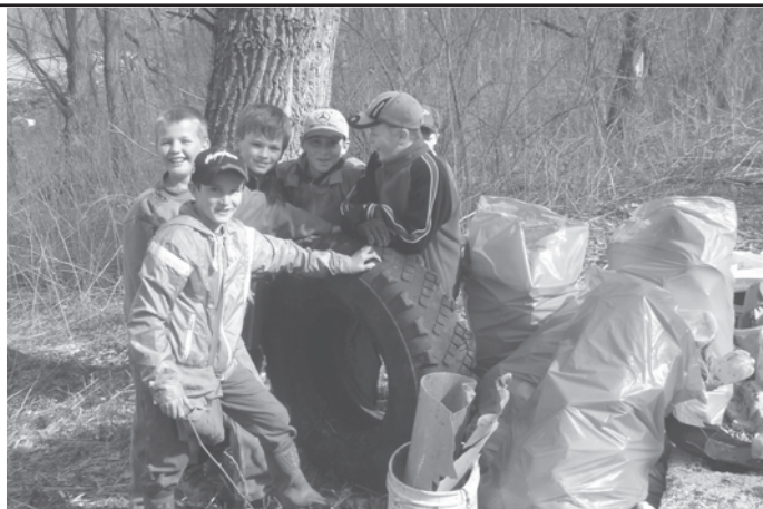
Pri istení dediny nezahá alli ani tí najmenší.