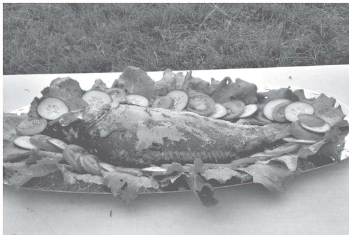
Obetné dary, pripravené po ovníckym zväzom, boli naozaj krásne a zaujímavé. Na fotografii ryba ako symbol trpezlivosti a lásky.