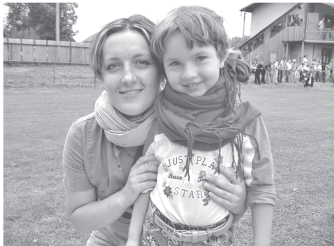
Sú ažiam neodolali ani rodičia, veľo by lovek neurobil pre svoje dieťa.

Súťažiam sa nevyhli ani dospeli, ktorí taktiež mohli získať užitočné ceny. Hod poleonom, skok vo vreci, strely do futbalovej bránky či