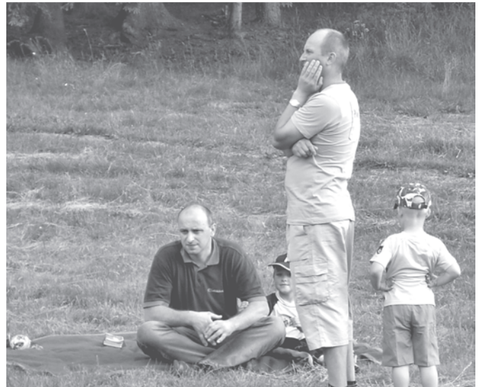
V prostredí nádhernej prírody si otcovia mohli svoj sviatok užiť naplno. Škoda, že po asie neprialo celý deň !