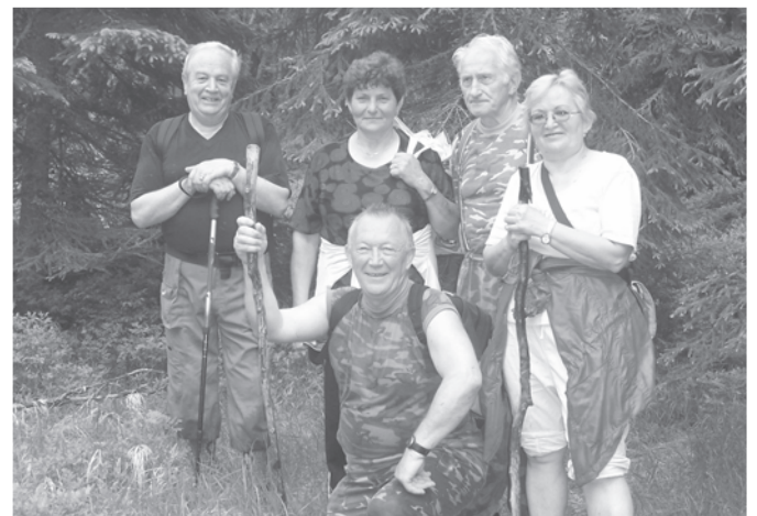
Ani turistické chodníky nám veru nie sú vzdialené, radi si počas výletov popozerať krásy našich lesov.